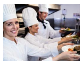
Op. delle transf. Agroalimentari