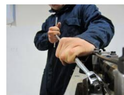
Op. alla rip. dei veicoli a motore